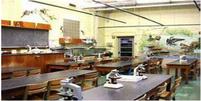
Gambar D. Ruang laboratorium