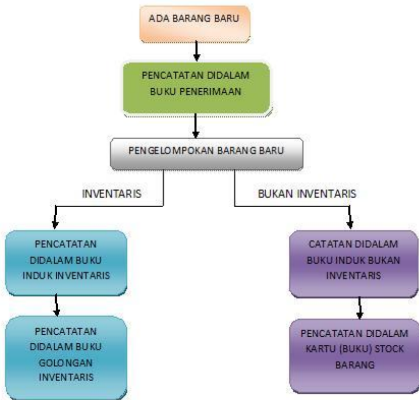
Gambar 2. Prosedur Inventarisasi Sarana Prasarana Sekolah

Tiap sekolah wajib menyelenggarakan inventarisasi barang milik negara yang dikuasai/diurus oleh sekolah masing-masing secara teratur, tertib dan lengkap. Kepala sekolah melakukan dan bertanggung jawab atas terlaksananya inventarisasi fisik dan pengisian daftar inventaris barang milik negara yang ada di sekolahnya. Secara umum, inventarisasi dilakukan dalam rangka usaha penyempurnaan pengurusan dan pengawasan yang efektif terhadap sarana dan prasarana yang dimiliki oleh suatu sekolah. Secara khusus, inventarisasi dilakukan dengan tujuan-tujuan sebagai berikut: