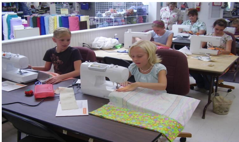
Gambar B. Ruang Praktik