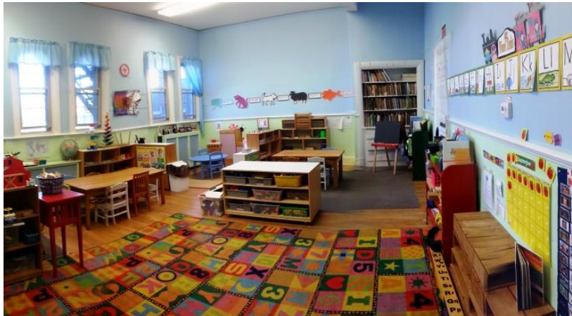
Gambar A. suasana Ruang belajar