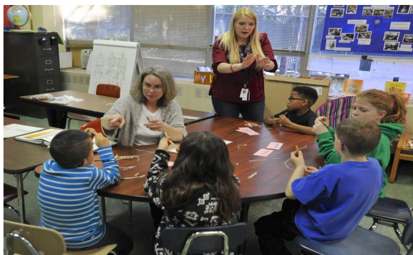
Gambar C. Ruang kelas